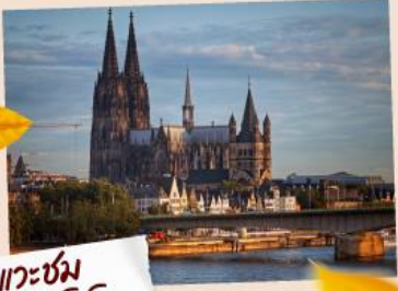
แควซ่ม มหาวิหารโคโลญ