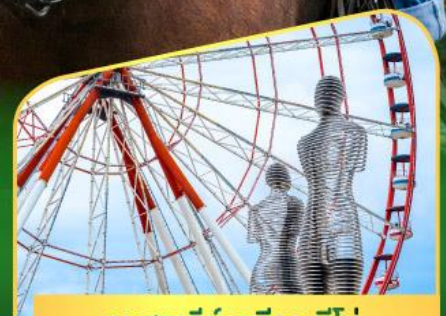
อนุสาวรีย์อาลีและนีโน่