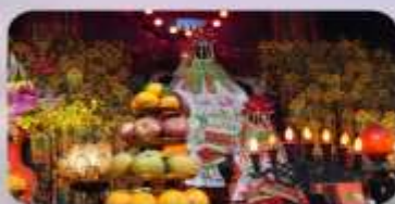
วัดกวนอิมสองฮิม