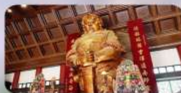
วัดกิ่งหินแขง