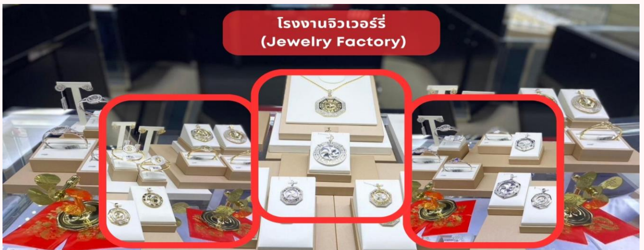
โรงงานจิวเวลรี่ (Jewelry Factory)

กลางวัน รับประทานอาหารกลางวัน ณ ภัตตาคาร (มื้อที่ 5) เมนูพิเศษ.. ท่านอย่าง