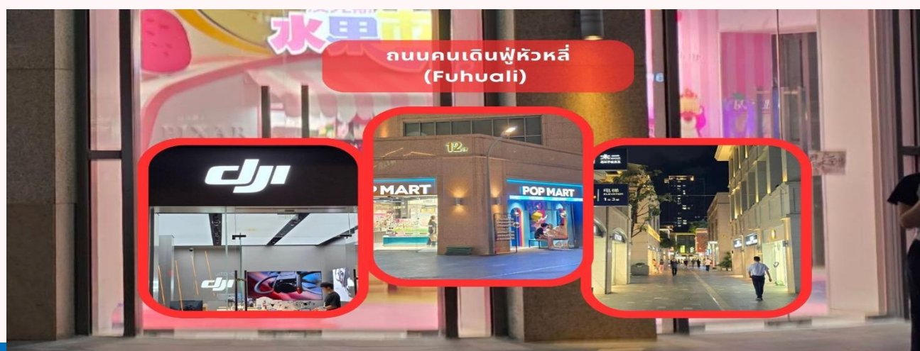
ถนนคนเดินฟู่หวาลี (Fuhuali)

นำท่านถ่ายรูปด้านหน้า โรงละครหอยไข่มุก (Zhuhai Opera House) หนึ่งในแลนด์มาร์กสำคัญของเมืองจูไห่ มีลักษณะทางสถาปัตยกรรมที่โดดเด่น ล้ำยุคและทันสมัย โดยมีการออกแบบเป็นรูปทรงเปลือกหอยประกบกันโค้งงอ ลงทุนก่อสร้างไปมากกว่า 1,008 ล้านบาท โดยได้รับการออกแบบเป็นรูปทรงเปลือกหอยฝาประกบกัน 2 อัน ที่ดูกิ่งโปรงใสในตอนกลางวัน และดูใสราวกับแสงจันทร์ในยามค่ำคืน ซึ่งด้วยเหตุนี้จึงเป็นที่มาให้กับชื่อเรียกของเปลือกหอยอันเล็กกว่า “เปลือกหอยดวงจันทร์” โดยเป็นโรงละครที่สามารถรองรับผู้เข้าชมได้ 500 คน และเปลือกหอยอันใหญ่กว่า “เปลือกหอยดวงอาทิตย์” ซึ่งเป็นโรงละครขนาดใหญ่ที่สามารถรองรับผู้เข้าชมได้มากถึง 1,600 คน และสามารถตอบสนองความต้องการด้านดนตรีขนาดใหญ่ ทั้งละครเพลง บัลเลต์ ซิมโฟนี และการแสดงสุดอลังการได้มากมาย