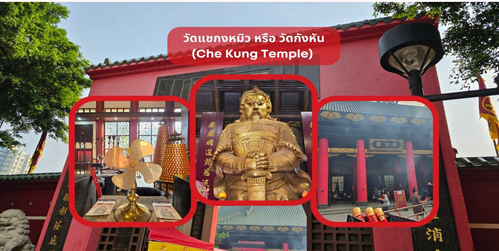
วัดแซกงหมีว หรือ วัดกังหัน (Che Kung Temple)

จากนั้นนำท่านชม ร้านหยก มีสินค้ามากมายเกี่ยวกับหยก อาทิ กำไลหยก หรือสัตว์นำโชคอย่างปีเสี้ยะ อีสระให้ได้เลือกซื้อเป็นของฝาก หรือเป็นของที่ระลึกนำโชคแต่ตัวเอง