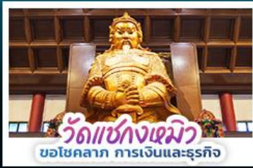
วัดแชกงเมียว ขอโชคลาภ การเงินและธุรกิจ