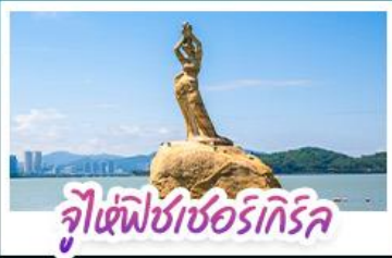
จุ๊เซ่พีซาชอร์ริกรีก