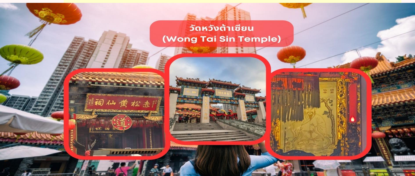
วัดหวังต้าเซียน (Wong Tai Sin Temple)

หมายเหตุ: ในการเดินทางข้ามด่านระหว่างแต่ละเมือง ท่านจำเป็นต้องแลกสัมภาระด้วยตนเอง และผ่านพิธีการตรวจคนเข้าเมืองตามขั้นตอน ซึ่งใช้ระยะเวลาในการเดินทางและดำเนินการโดยประมาณ 45-60 นาที