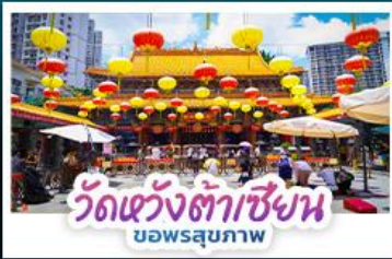
วัดเซ่งเต้าเซี่ยน ขอพรสุขภาพ