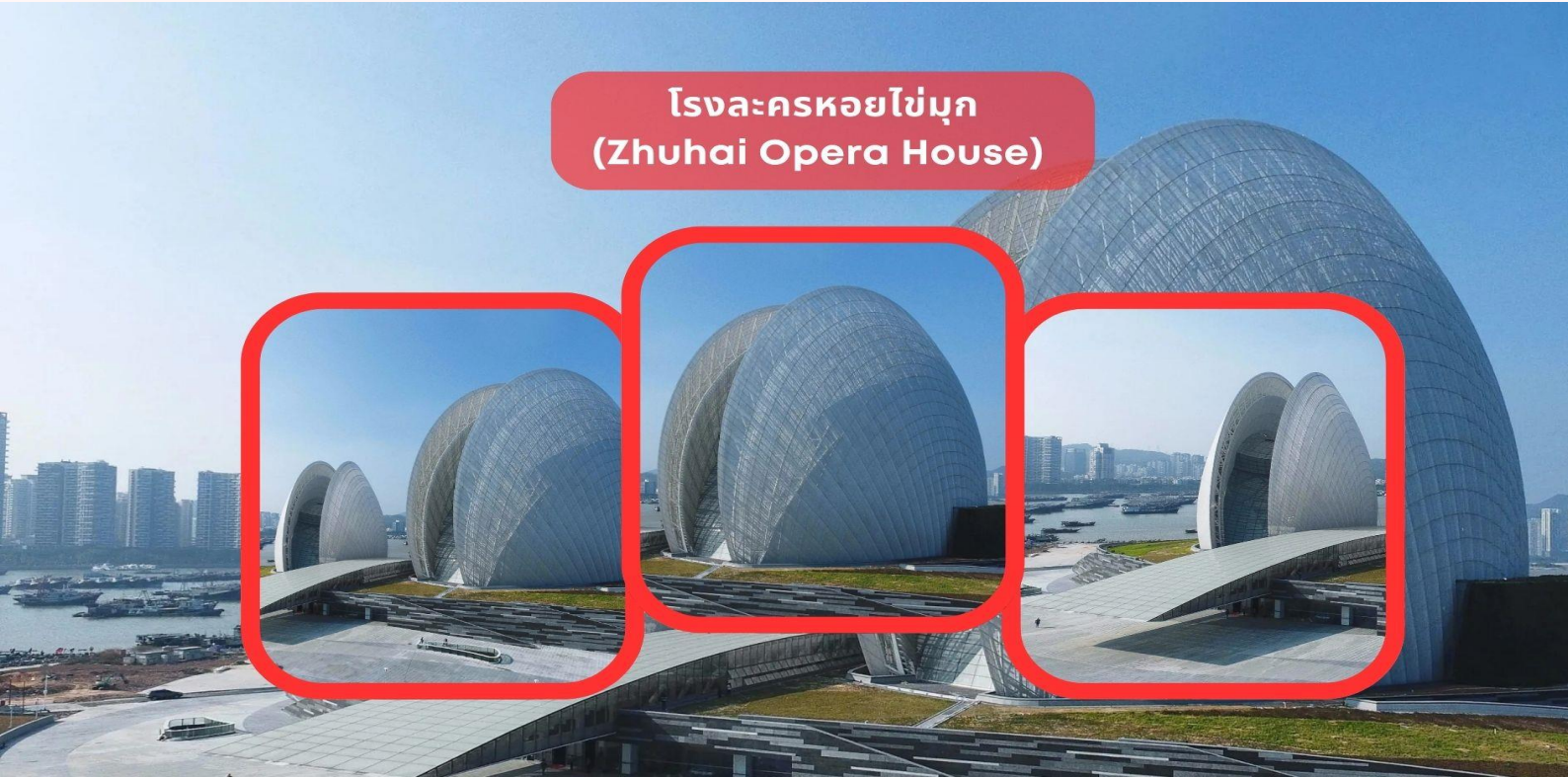
โรงละครหอยไข่มุก (Zhuhai Opera House)

นำท่านถ่ายรูปด้านหน้า โรงละครหอยไข่มุก (Zhuhai Opera House) หนึ่งในแลนด์มาร์กสำคัญของเมืองจูไห่ มีลักษณะทางสถาปัตยกรรมที่โดดเด่น ล้ำยุคและทันสมัย โดยมีการออกแบบเป็นรูปทรงเปลือกหอยประกบกันโค้งงอ ลงทุนก่อสร้างไปมากกว่า 1,008 ล้านบาท โดยได้รับการออกแบบเป็นรูปทรงเปลือกหอยฝาประกบกัน 2 อัน ที่ดูกิ่งโปรงใสในตอนกลางวัน และดูใสราวกับแสงจันทร์ในยามค่ำคืน ซึ่งด้วยเหตุนี้จึงเป็นที่มาให้กับชื่อเรียกของเปลือกหอยอันเล็กกว่า “เปลือกหอยดวงจันทร์” โดยเป็นโรงละครที่สามารถรองรับผู้เข้าชมได้ 500 คน และเปลือกหอยอันใหญ่กว่า “เปลือกหอยดวงอาทิตย์” ซึ่งเป็นโรงละครขนาดใหญ่ที่สามารถรองรับผู้เข้าชมได้มากถึง 1,600 คน และสามารถตอบสนองความต้องการด้านดนตรีขนาดใหญ่ ทั้งละครเพลง บัลเลต์ ซิมโฟนี และการแสดงสุดอลังการได้มากมาย