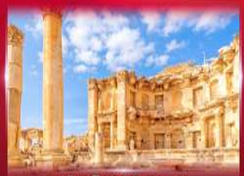
เมืองโบราณเพตรา