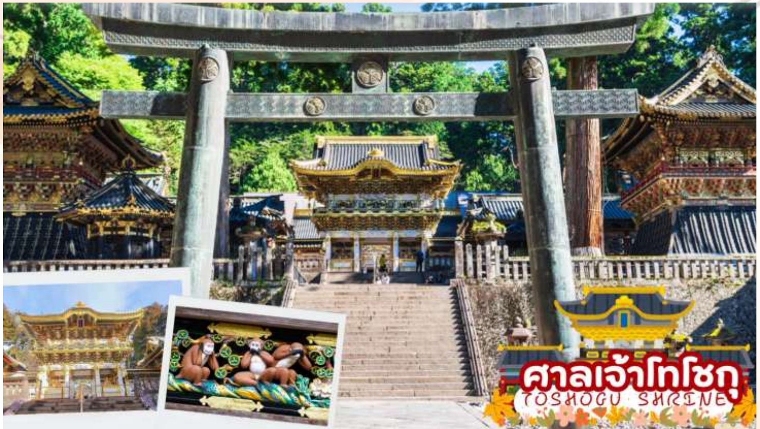
ศาลเจ้าโทโชกุ TOSHOGU SHRINE

ศาลเจ้าโทโชกุ (Toshogu Shrine) ศาลเจ้าที่สร้างเพื่อเป็นสถานที่ฝังศพโชกุนโทกูงาวะ ที่เก่าแก่นับ 4 ศตวรรษ ตั้งแต่สมัยโชกุนโตกูงาวะ อิเอยะสึ อาคารแต่ละหลังจะสร้างจากไม้ลงลายสีทอง มีสถาปัตยกรรมไม้แกะสลักที่วิจิตรตระการตาทั้งสวยงามในแง่ของศิลปะและที่แฝงแง่มุมทางปรัชญาทางเข้าจะเป็นซุ้มประตูโยเมมง (Yomeimon) เป็นซุ้มประตูที่สวยงาม มีขนาดใหญ่ ด้านในเป็นอาคารไม้ มี รูปลิงแกะสลัก 3 ตัว อยู่ในท่า ปิดหู ปิดปาก ปิดตา หมายถึง การไม่ดู ไม่ฟัง ไม่พูดในสิ่งไม่ดี และบริเวณซุ้มประตูก่อนขึ้นบันไดไปสู่ลานฯ มีรูปแกะสลักไม้ที่มีชื่อเสียง เป็น รูปแมวหลับ เป็นผลงานของ Hidari Jingoro ที่สำคัญศาลเจ้าแห่งนี้ได้รับการขึ้นทะเบียนจากองค์การยูเนสโก ให้เป็นหนึ่งในมรดกโลกทางวัฒนธรรม