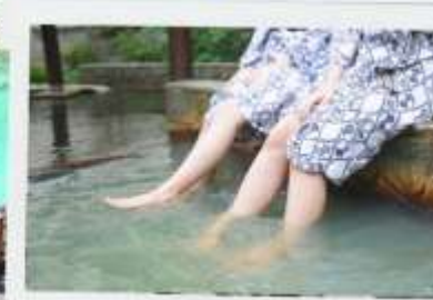
บ่อน้ำพุร้อน ยูกาตะเกะ KUSATSU ONSEN YUBATAKE

เมืองคุซาสึ เป็นเมืองออนเซ็นที่ได้รับความนิยมอย่างมากในญี่ปุ่น เนื่องจากมีปริมาณน้ำร้อนที่ผุดขึ้นเองตามธรรมชาติ โดยไม่ต้องใช้เครื่องสูบใดๆ ชมบ่อน้ำพุร้อน ยูกาตะเกะ สิ่งก่อสร้างขนาดใหญ่ใจกลางเมืองซึ่งถูกเรียกว่า “ ยูกาตะเกะ (Yubatake) ” มีหมายความว่า “ทุ่งน้ำร้อน” ควันไอน้ำที่ลอยขึ้นมาและกลืนอายุเฉพาะตัวของบ่อน้ำร้อนจะช่วยให้ท่านรู้สึกเพลิดเพลินกับการเดินทาง รอบๆ เมืองเต็มไปด้วยที่พักและร้านอาหารของที่ระลึก ได้บรรยากาศของแหล่งออนเซ็นญี่ปุ่นแท้ๆ เป็นเอกลักษณ์อย่างหนึ่งของบ่อน้ำพุร้อนคุซาสึ