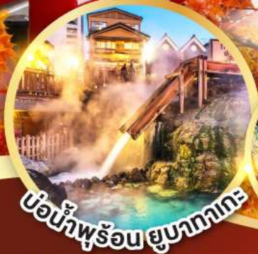
บ่อน้ำพุร้อน ยูมาทากะ