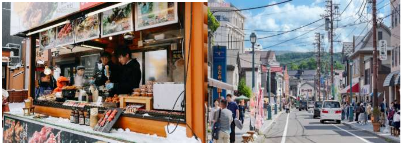
เที่ยง อิสระอาหาร ตามอัธยาศัยเพื่อสะดวกแก่การท่องเที่ยว

อิสระเดินเล่น ถนนซากาอิ (SAKAIMACHI STREET) ตั้งอยู่กลางเมืองโอตารุ ไม่ไกลจากคลองโอตารุ เป็นแหล่งท่องเที่ยวแลนมาร์กของเมืองนี้ เนื่องจากตัวถนนเองได้รับการอนุรักษ์มาอย่างดีเยี่ยมจนกลายมาเป็นถนนแหล่งช้อปปิ้งชื่อดังของเมืองโอตารุอย่างในปัจจุบันนี้ ในระหว่างช่วงพัฒนาฮอกไกโดปลายยุค 1800 ต้นยุค 1900 เมืองโอตารุเป็นเมืองท่าเรือ และการค้าการขนส่งที่หลากหลาย เต็มไปด้วยบริษัทชิปปิ้ง อาคารต่างๆเป็นแบบสไตล์ตะวันตก ปัจจุบันได้รับการดัดแปลงเป็นร้านค้า ร้านอาหาร ร้านกาแฟ ร้านขายของที่ระลึก ร้านเสื้อผ้า และพิพิธภัณฑ์ต่างๆมากมาย