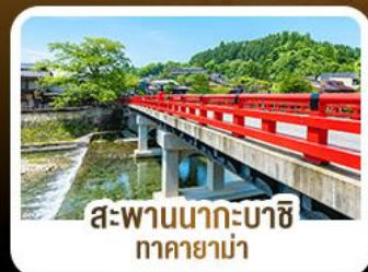
สะพานนากะบาชิ ทาดายาม่า