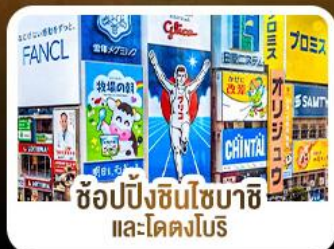
ช้อปปิ้งชินโซบาชิ และโดตงโบริ