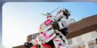
ซอปปิงไอโดบะ