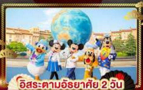
อิสระตามอริยาศัย 2 วัน