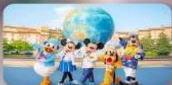
อิสระตามอริยาซึย 2 วัน