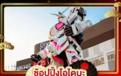
ช้อปปิ้งโอไดบะ