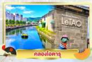
คลองโฮตารุ