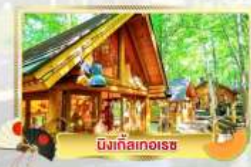
นิงเกิ้ลทอเรซ