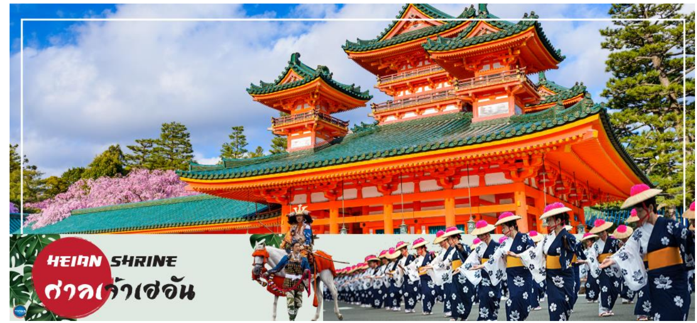
HEIAN SHRINE ศาลเจ้าเฮอัน

เช้า รับประทานอาหารเช้า ณ ห้องอาหารของโรงแรม (4)