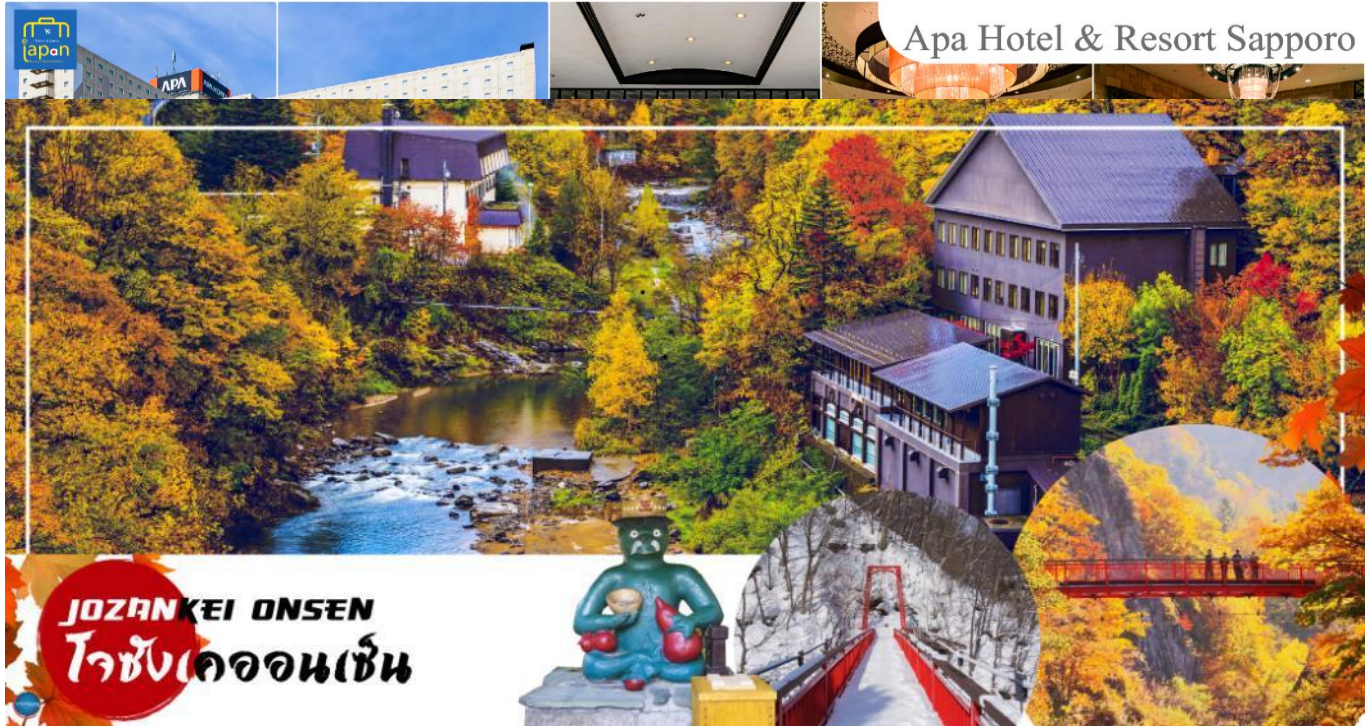
Apa Hotel & Resort Sapporo

--ให้ท่านได้ผ่อนคลายกับการแช่น้ำแร่ธรรมชาติ ออนเซน เชื่อว่าถ้าได้แช่น้ำแร่แล้ว จะทำให้ผิวพรรณสวยงามและช่วยให้ระบบหมุนเวียนโลหิตดีขึ้น--