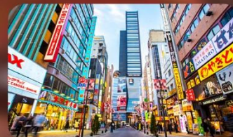
ซัปโปริงชินจูกุ