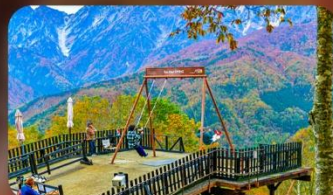
ฮาคูบะอิวัตากะ