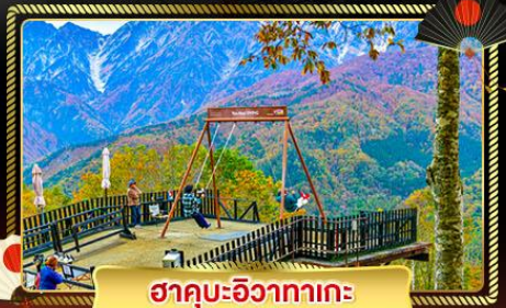
ฮาคุบะฮิงาซากะ