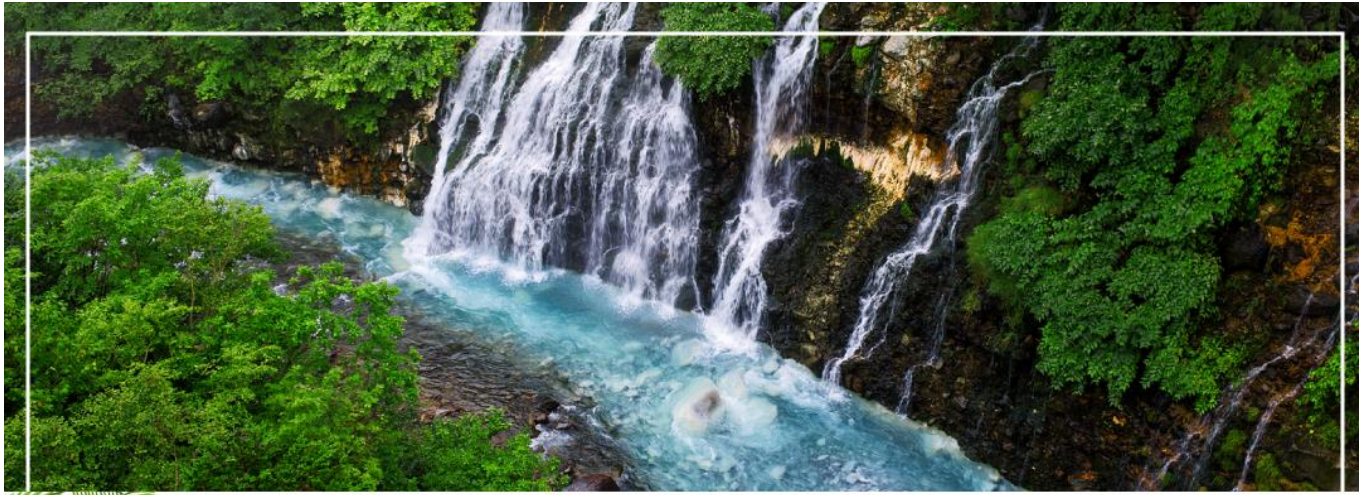
SHIRAHIGE WATERFALL น้ำตกชิราฮิเกะ

วันที่สอง ท่าอากาศยานนิวยอร์กโตเสะ สอกไกโด – เมืองบิเอะ – น้ำตกชิราฮิเกะ – สระอะโออิเคะ หรือ บ่อน้ำสีฟ้า – เมืองอาซาฮิดาวา – อีออน อาซาฮิดาวา