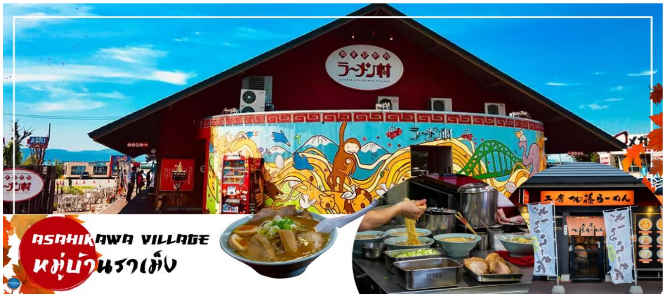
ASAHIKAWA VILLAGE หมู่บ้านราเม็ง

วันที่สาม เมืองอาซาฮิคาว่า – ศาลเจ้าคามิกาวะ – หมู่บ้านราเมงอะซาฮิยาม่า – เมืองมิเอะ – น้ำตกชิราอิเกะ – สระอะโออิเคะ หรือ บ่อน้ำสีฟ้า – เมืองซัปโปโร