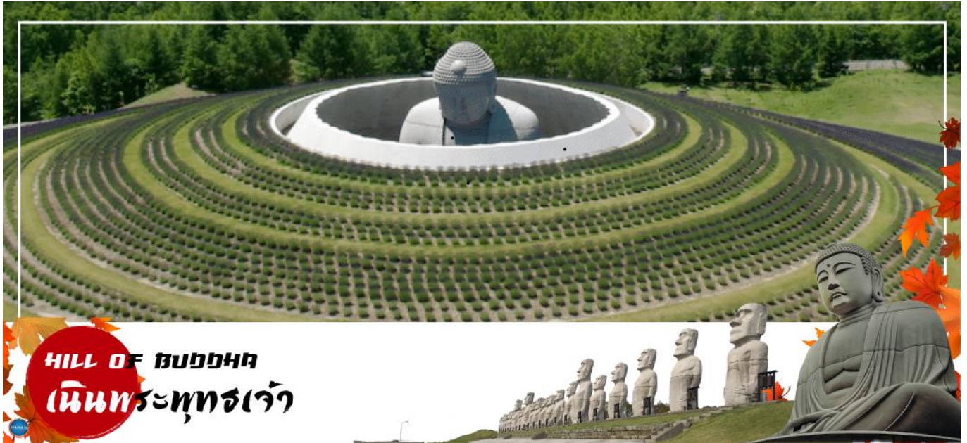
HILL OF BUDDHA เนินพระพุทธรเจ้า