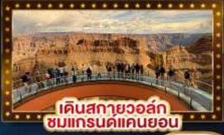
เดินสกายวอล์ก ชมแกรนด์แคนยอน