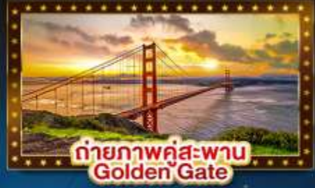
ถ่ายภาพคู่สะพาน Golden Gate