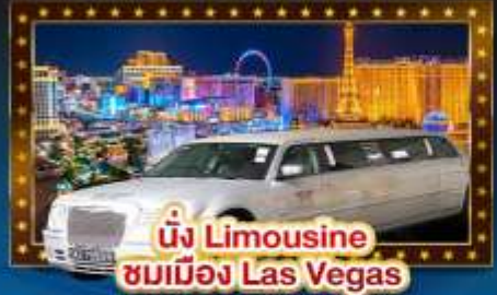
นั่ง Limousine ชมเมือง Las Vegas