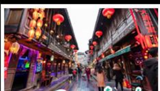
ถนนโบราณจี้มู่