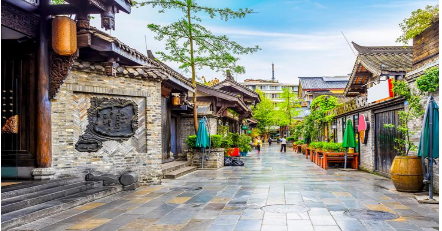
กลางวัน รับประทานอาหารกลางวัน ณ ภัตตาคาร (เมื่อที่ 11)