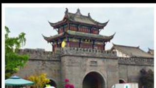
เมืองโบราณกวมเสียน

ภูเขาสี่ครุณี - อุทยานป่ฉิงโกว - สะพานหนามเขียว - ร้านหนังสือจงซูเก้อ - เมืองโบราณกวมเสียน จตุรัสหย่างเทียนหู่ - หมีแพนด้าเซลฟี - ถนนโบราณชอยกว้างชวยแคบ - ถนนคนเดินไท่กู๋หลี่ ถนนคนเดินซุนซี - ถนนโบราณจี้มู่ - แพนด้ายักษ์ปีนตึก - น้ำพุไม้ไผ่ตึกSKP - วัดต้าเจี๋ย