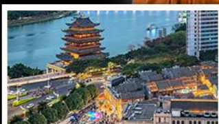
ถนนคนเดินสามตรอกสองซอย