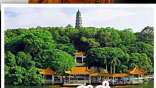
ภูเขาซิงซิว