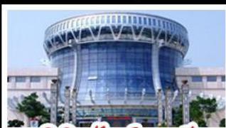
พิพิธภัณฑ์กังวาลี่

สวนสนุก FANTASYLAND - หมู่บ้านสไตล์ยุโรป พิพิธภัณฑ์กังวาลี่ - ถนนคนเดินสามตรอกสองซอย ท่าเรือกิ่งจื่อ - ศาลเจ้าแม่กวนอิมพินกร เมมูพิเศษ อาหารกังวาลี่ , สุกี้ซาบูหมาล่า