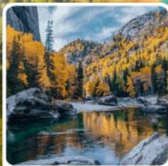
เคอเคอทิวไห่