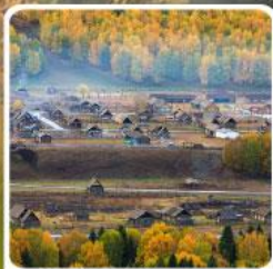
หมู่บ้านเหม่อู๋

สวรรค์ใบไม้เปลี่ยนสี เยือนคานาสีอแดนฝัน มหัศจรรย์หมู่บ้านเหม่อู๋ เคอเคอทิวไห่อัศจรรย์ภูผาหิน