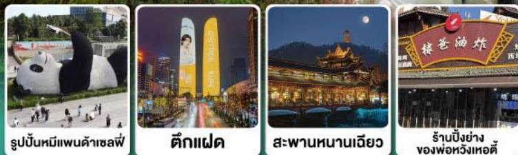
รูปปั้นหมีแพนด้าเซลฟ์ ตึกแฝด สะพานหนานเฉียว ร้านปังย่างของพ่อหวังเหอตี้

แวะชิมปังย่างหม่าล่า ร้านคุณพ่อ (แฉ่งแฉต๊) ที่เมืองเล่อชาน