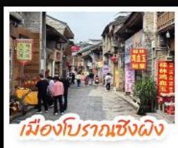
เมืองโบราณเซียงผิง

เช็คอินจุดไฮไลท์โลกทัยหลิน เจดีย์เงินเจดีย์ทอง ไขวงวงช้าง นั่งคานูล่องลำน้ำหลีเจียง จุดชมวิวกะลาภูเขา แห่งเมืองหยางซิว ล่องเรือแม่น้ำหลีเจียง ตามรอยช้างหลังภาพธนบัตร 20 หยวน อีสรระซ้อปึงถนนคนเดิน 2 แห่ง ถนนดงซีเซียง ถนนซีเจียง นั่งกระเช้าบอลลูนชมวิวกว๊าน 360 องศา