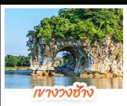
เขาวงวงช้าง