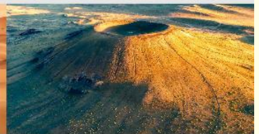
ภูเขาไฟอูลันฮาตา

*ทางบริษัทฯ ขอสงวนสิทธิ์ในการสลับโปรแกรมทัวร์ตามความเหมาะสมขึ้นอยู่กับสถานการณ์ทำงาน โดยคำนึงถึงผลประโยชน์ของลูกค้าเป็นสำคัญ