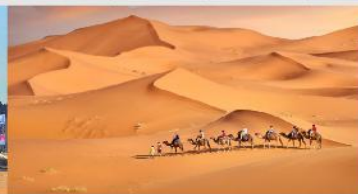
ทะเลทรายเสียงชวาน