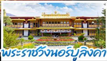
พระราชวังเนอร์บูลิงคา