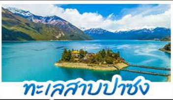
ทะเลสาบปาซง