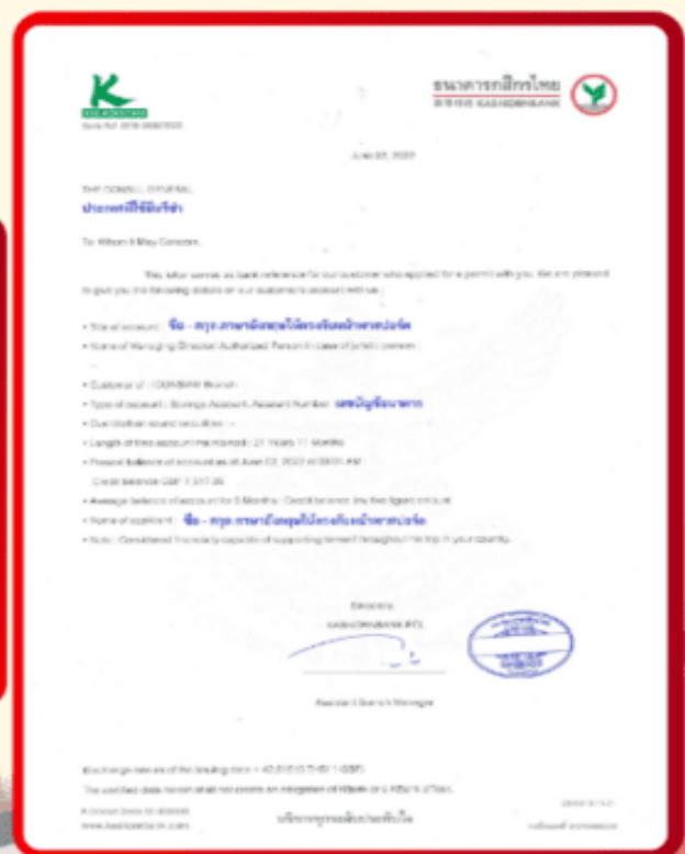
ตัวอย่าง Bank Guarantee ที่ผู้สมัครต้องขอธนาคาร