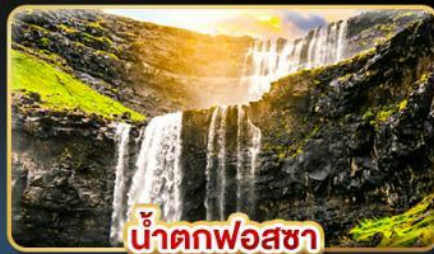
น้ำตกฟอสซา