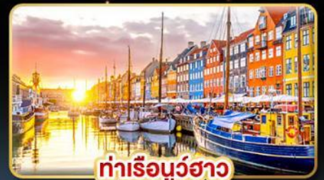
ท่าเรือบูฮาว