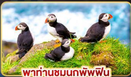
พาท่านชมนกพิพฟิน