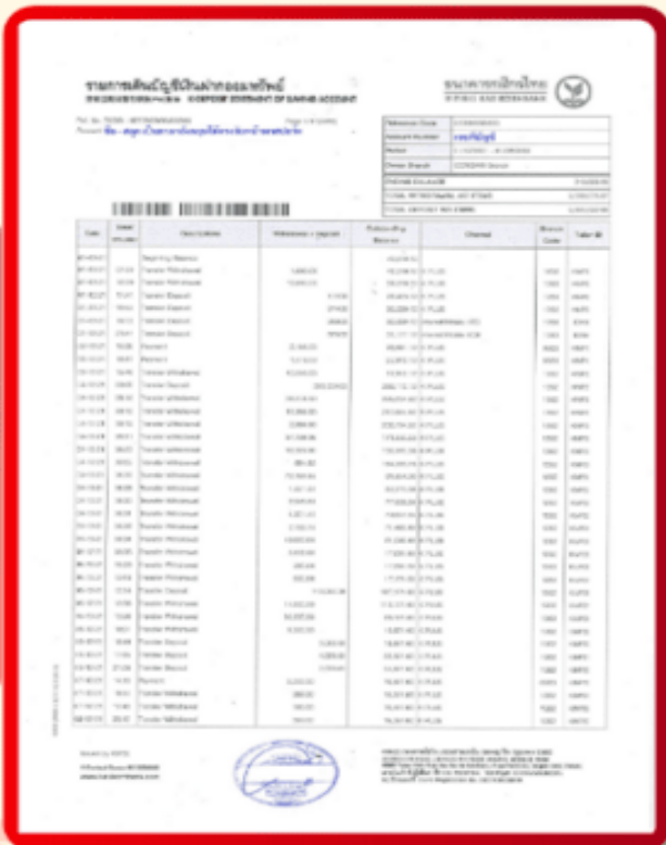
ตัวอย่าง Bank Statement ที่ผู้สมัครต้องขอธนาคาร

3.4 ปรับสมุดบัญชีธนาคารตัวจริง และเตรียมไปในวันที่ยื่นวีซ่า