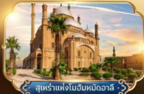
สุเหร่าแห่งโมฮัมหมัดอาลี