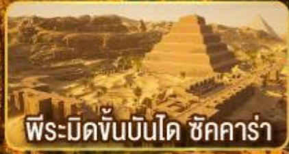
พีระมิดขั้นบันได ชัคคาร่า