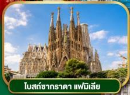
โบสถ์ซากราดา แฟมิเลีย