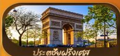
ประตูชัยฝรั่งเศส