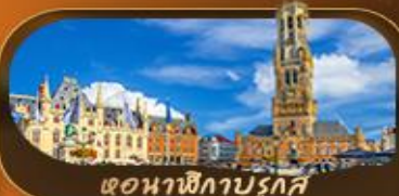
ตอนาฬิกาบรูจส์

สัมผัสความสโลว์ไลฟ์ล่องเรือชมหมู่บ้านกังธูร์น กึ่งหินลมซานส์สคันส์ คลองอัมสเตอร์ดัม ตื่นตาตื่นใจกับปราสาทกราเวนสตีน หอระฆังแห่งเกนต์ ย้อนอดีตโบสถ์อวาร์เลดี หอนาฬิกาบรูจส์ บริษัทชลส์ อะโตเมียม รูปปั้นแบนิกันพีส พระราชวังหลวงแห่งบริษัทชลส์ เข็ควินโฮลท์ ประตูชัยฝรั่งเศส หอไอเฟล พิพิธภัณฑ์ลูฟร์ ล่องเรือแม่น้ำแซนสุดโรแมนติก และช้อปปิ้งจุใจที่ห้างชั้นนำ