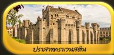
ปราสาทราเวนสตี