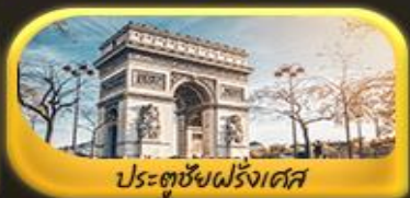
ประตูชัยฝรั่งเศส

พิเศษ!! ล่องเรือแม่น้ำแซนชมเมือง โดย บาโด บูช