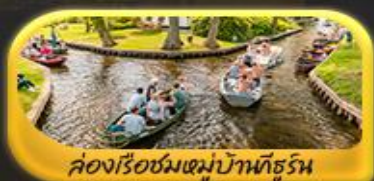
ล่องเรือชมหมู่บ้านกังหัน