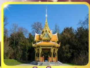
ศาลาโทโยไซซานน์