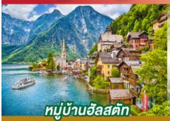
หมู่บ้านอัลสติก