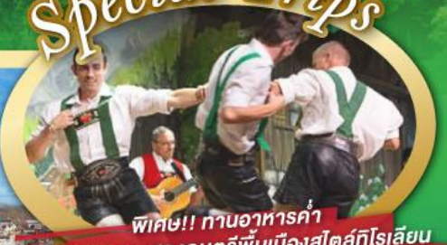
พิเศษ!! กานอาหารค่ำ พร้อมชมการแสดงดนตรีพื้นเมืองสโกล์ทโรเลียน และเยือนเมืองอูเทรคต์ สีสันใหม่เนเธอร์แลนด์