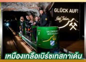
เหมืองเกลือเบิร์ชเทสกาเดิน