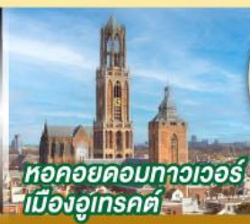
หอคอยคอมพิวเตอร์ เมืองอูเทรคต์