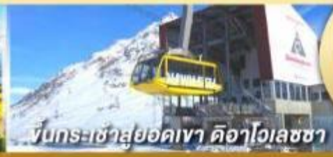
ขึ้นกระเช้าสู่ยอดเขา ดืออาโวลซช