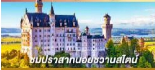
ชมปราสาทนอยชวานสไตน์