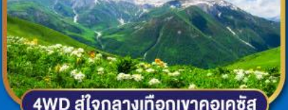
4WD สู่ใจกลางเทือกเขาคอเคซัส