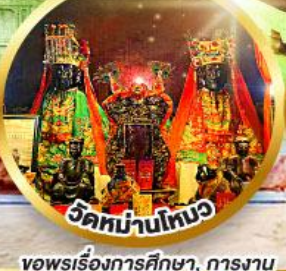
วัดม่านโหมว ขอพรเรื่องการศึกษา, การงาน สติปัญญาและความกล้าหาญ