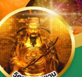
วัดหยวนทง ขอพรเรื่องสุขภาพ, โชคลาภ ความเจริญก้าวหน้า

เมนูพิเศษ! ต้มช่าฮ่องกง, บุฟเฟ่ต์ซาบูสโตลล์ฮ่องกง, ห่านย่าง