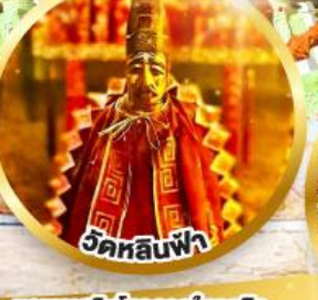
วัดหลินฟ้า ขอพรเสริมโชคลาภในธุรกิจ และการเงิน