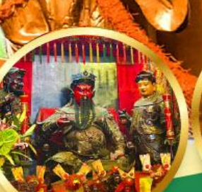
วัดกวนไท่ ขอพรเทพเจ้ากวนอู เงินทอง, ธุรกิจมั่นคง