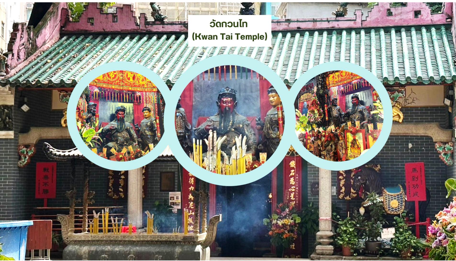
วัดกวนไท (Kwan Tai Temple)

จากนั้นนำท่านชม ร้านหยก มีสินค้ามากมายเกี่ยวกับหยก อาทิ กำไลหยก หรือสัตว์นำโชคอย่างปีเสี้ยะ อีสระให้ ได้เลือกซื้อเป็นของขวัญ หรือเป็นของที่ระลึกนำโชคแต่ตัวเอง