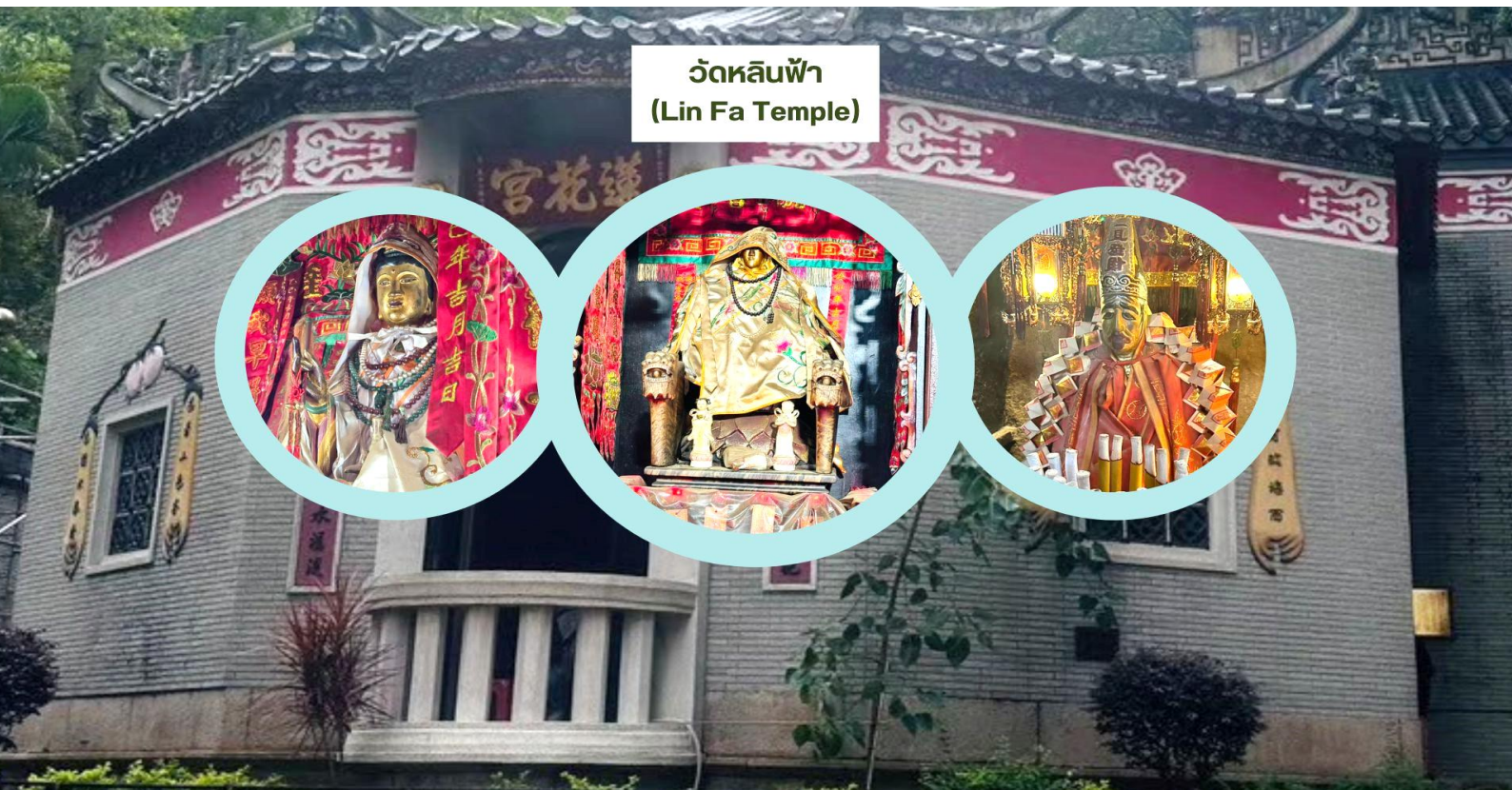
วัดหลินฟ้า (Lin Fa Temple)

เรียกว่ามาที่เดียวได้ขอพรกันครบเลย ไม่ว่าจะใครจะขอพรอันใดก็สมหวัง สมความปรารถนาทุกประการ