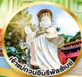
เจ้าแม่กวนอิมรั้วลั่นघ ขอพรรับพลังงานดี เสริมพลังของขวัญ