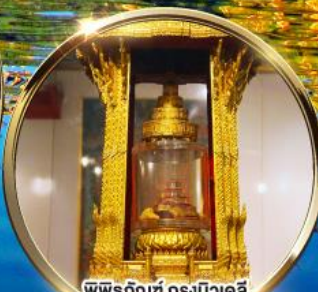
พิพิธภัณฑ์ กรุงนิวเดลี กราบมัสการพระบรมสารีริกธาตุ