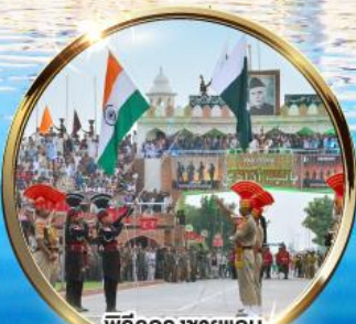
พิธีลดธงชาติ อินเดีย-ปากีสถาน, ด้านวาทาห์