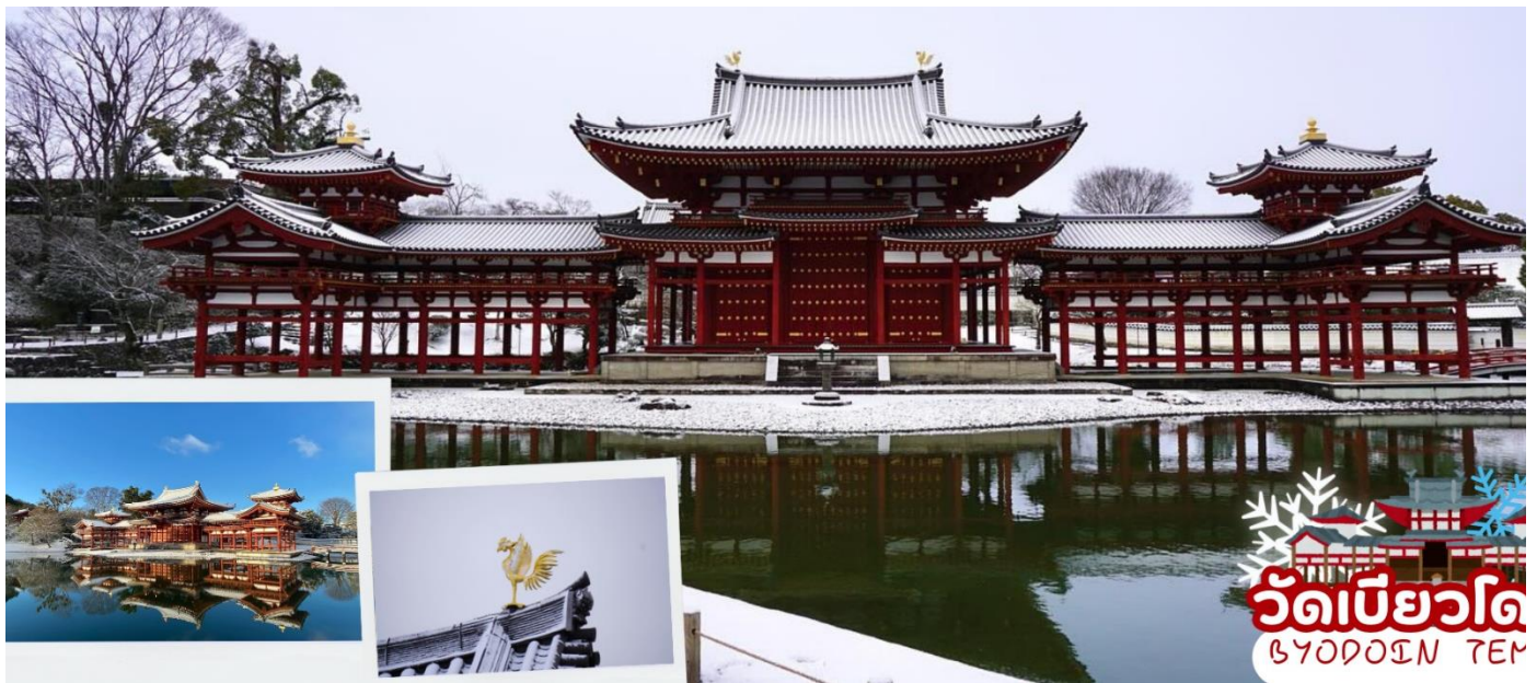
วัดบิยาวโดอิน BYODOIN TEM

นำทุกท่านเดินทางสู่ เมืองอุจิ (Uji) เมืองเล็กๆที่มีเสน่ห์ทางตอนใต้ของจังหวัดเมืองเกียวโต เป็นเมืองที่ขึ้นชื่อเรื่องชาเขียวอุจิมัทฉะ (Uji Matcha) และคาเฟ่น่ารักๆ ชาเขียวที่เมืองอุจิได้รับการยอมรับว่าเป็นชาเขียวคุณภาพดีที่สุดในญี่ปุ่น และยังเป็นเมืองที่เหมาะสมแก่การมาพักผ่อน เต็มไปด้วยวัดและโบราณสถานที่ได้รับมรดกโลกจากทาง Uneso