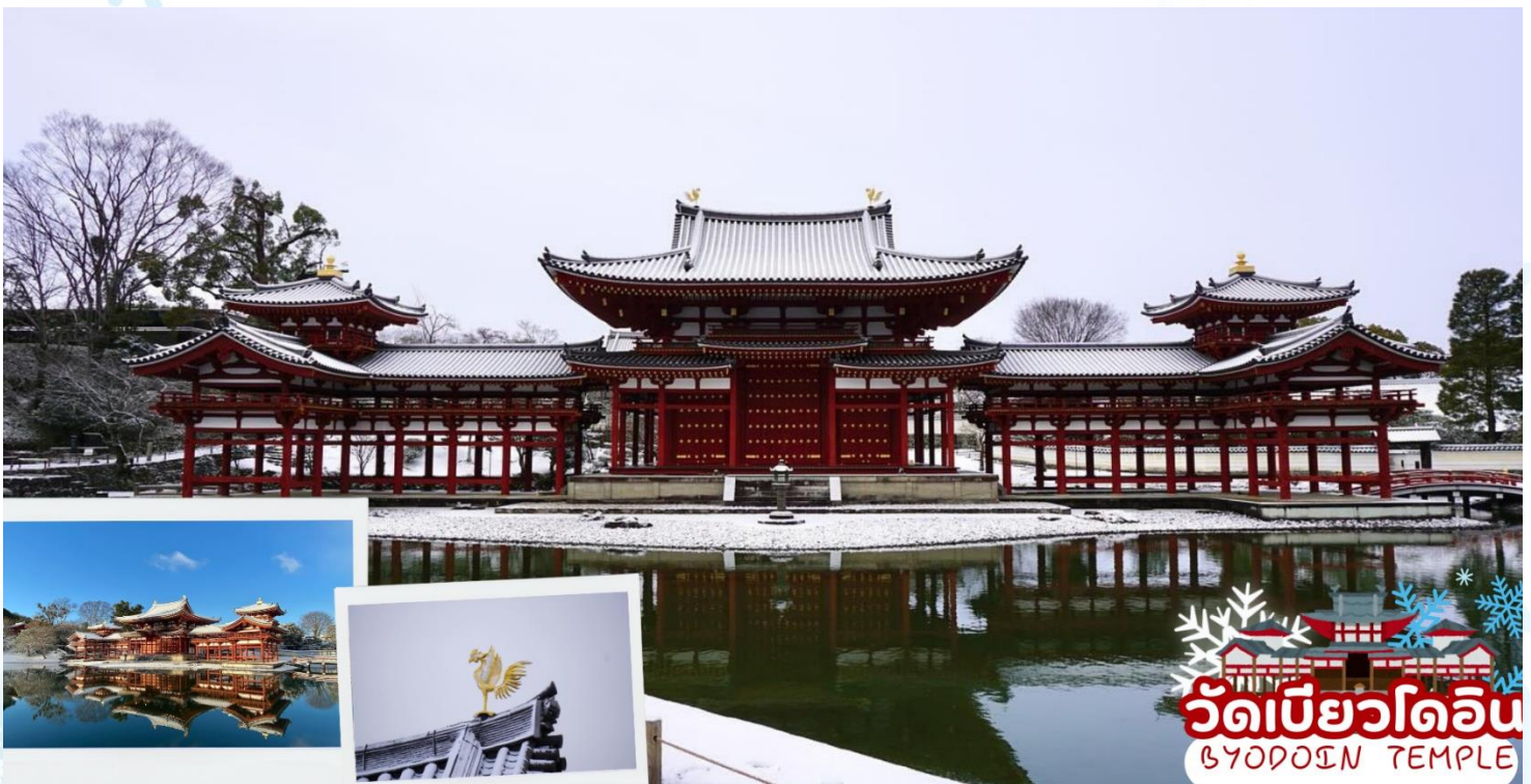
วัดเบียวโดอิน BYODOIN TEMPLE

นำท่านชม วัดเบียวโดอิน (Byodoin Temple) เป็นวัดเก่าแก่ที่ได้รับการขึ้นทะเบียนเป็นมรดกโลก Uneso World Heritage สร้างขึ้นตั้งแต่สมัยเฮอันในปี ค.ศ. 1052 จุดเด่นของวัดเบียวโดอินคือ ห้องโถงฟินิกซ์ (Phoenix Hall) หรือ วิหารไม้สีแดงสดตั้งอยู่ตรงใจกลางวัด ด้วยความงดงามมาแต่อดีตจนถึงปัจจุบัน วิหารแห่งนี้จึงได้รับเลือกให้ปรากฏอยู่บนเหรียญสิบเยนของประเทศญี่ปุ่น ด้วยความสวยงามด้านสถาปัตยกรรมที่โดดเด่น มากที่สุดแห่งหนึ่งของญี่ปุ่น ทำให้วัดแห่งนี้ได้รับความนิยมจากนักท่องเที่ยวไม่ขาดสาย