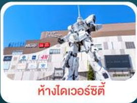
ห้างโตเวอร์ซิตี