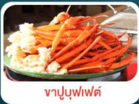
ชาบูบุฟเฟ่ต์