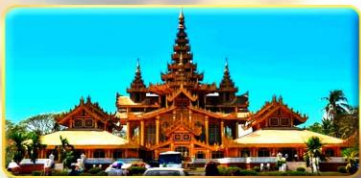
พระราชวังบุรงนอง

โรงแรม เมืองย่างกุ้ง หรือเทียบเท่า 5 ดาว