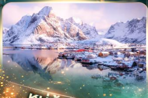
หมู่บ้านเรนเน