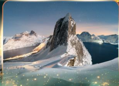
เกาะเซนญา