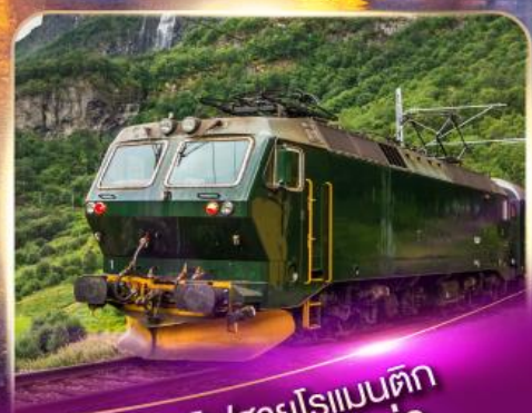
รถไฟสายโรแมนติก ฟลินส์บาน่า