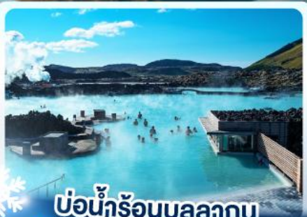
แช่น้ำร้อนบลูลากูน

เก็บไอซ์แลนด์ แดนภูเขาไฟคิรคจูพล และ แช่น้ำร้อนบลูลากูน