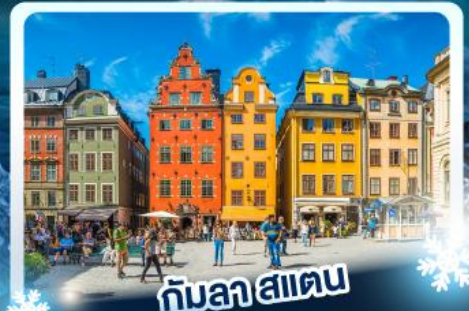
กับลาฮาน