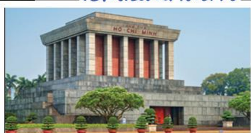
จัตุรัสบาติงห์