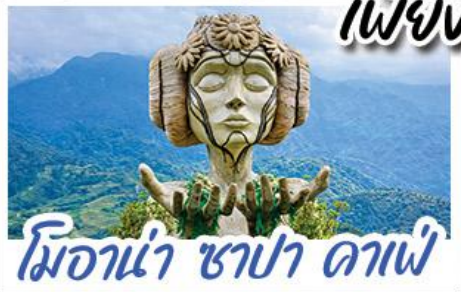
มโอราน่า ซาปา ดาเฟ้