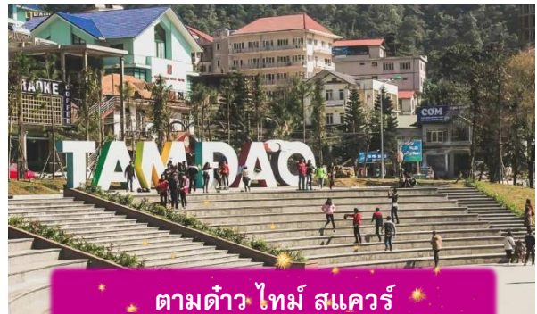
ตามดาว ไทม์ สแควร์

ที่พัก TAMDAO HOTEL ระดับ 3 ดาวมาตรฐานท้องถิ่น หรือเทียบเท่า