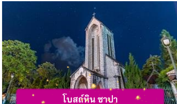
โบสถ์หิน ซาปา