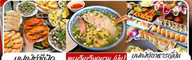
บุฟเฟ่ต์ซีฟู้ด | หมกจีนวังคดตาม (บุ๋น) | บุฟเฟ่ต์อาหารญี่ปุ่น Bababa Japanese Restaurant