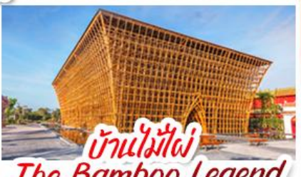
บ้านไม้ไผ่ The Bamboo Legend