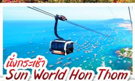
นั่งกระเช้า Sun World Hon Thom