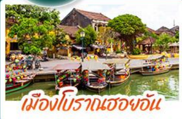
เมืองโบราณฮองอัน

สัมผัสเสน่ห์เวียดนามกลาง พักบานาฮิลล์ 1 คืน • สัมผัสอากาศเย็นตลอดปี สโตร์ฝรั่งเศสสุดคลาสสิกฟิล์มขึ้นสวรรค์ • นั่งกระเช้าสู่ยอดเขาบานาฮิลล์ ชมสะพานมือยักษ์แลนด์มาร์กดังระดับโลก • ชมวิหารเจ้าแม่กวนอิมองค์ใหญ่ที่สุดของเมืองดานัง • เช็คอินเมืองมรดกโลก พักเมืองฮอยอัน 1 คืน • สนุกสนานไปกับกิจกรรม!! นั่งเรือกระดิง หมู่บ้านกัมกาน • เช็คอินร้านอาหาร SON TRA MARINA CAFE • อิมเมอร์กับบุฟเฟ่ต์นานาชาติ หม้อไฟซีฟู้ด พร้อมเสิร์ฟทั้งมิตรภาพและครั้งเดียว