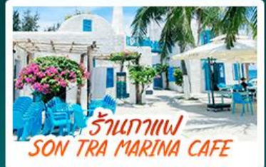
ร้านอาหาร SON TRA MARINA CAFE