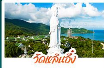
วัดเข้ลิเอ็ง