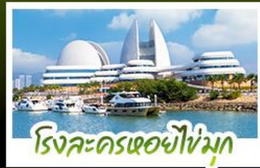
โรงละครเซอซิงมุก