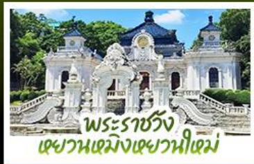
พระราชวัง เซวามเม็งเซวานีเซม