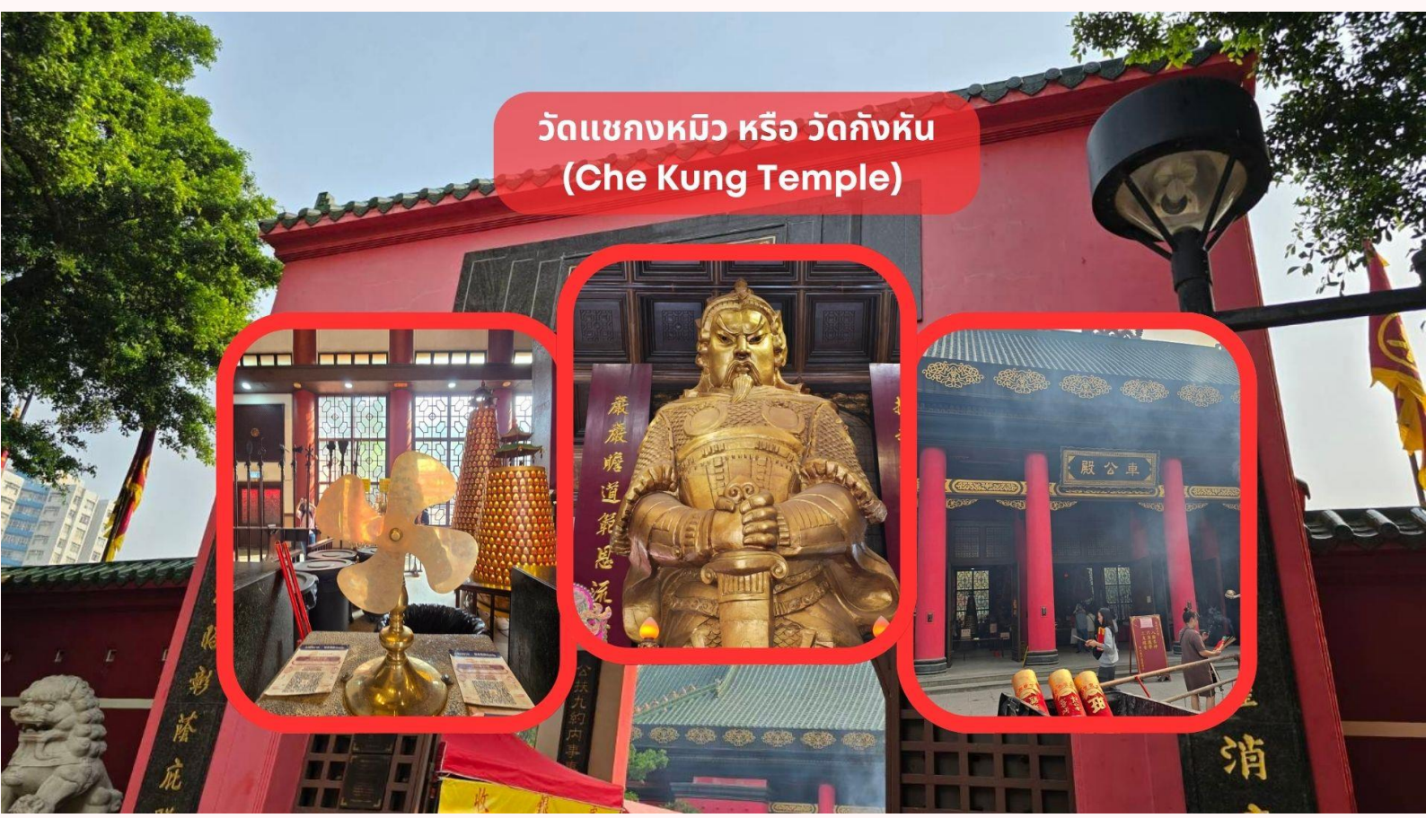
วัดแขกหมิว หรือ วัดกังหัน (Che Kung Temple)

จากนั้นนำท่านชม ร้านหยก มีสินค้ามากมายเกี่ยวกับหยก อาทิ กำไลหยก หรือสัตว์นำโชคอย่างปี่เสีเยะ อีสระให้เลือกรับซื้อเป็นของฝาก หรือเป็นของที่ระลึกนำโชคแต่ตัวเอง