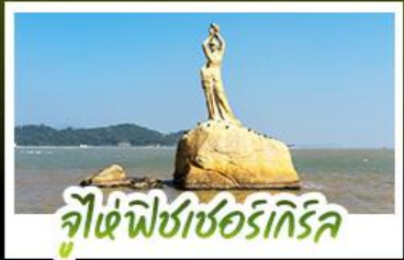
จุไห้พิชเชอร์เกิร์ล

ดื่มด่ำบรรยากาศสุดคลาสสิกสไตล์อังกฤษ ณ THE LONDONER MACAO ไหว้พระดัง 3 วัดดัง ขอพรการทำงาน การเงิน ความรัก ครอบจบในทริปเดียว ชมความวิจิตรตระการตาของพระราชวังหยวนหมิงหยวนใหม่แห่งจุไห้ ช้อปปิ้งจุใจ ย่านจิมซาจุ้ยและถนนคนเดินฟู้ทวอลล์